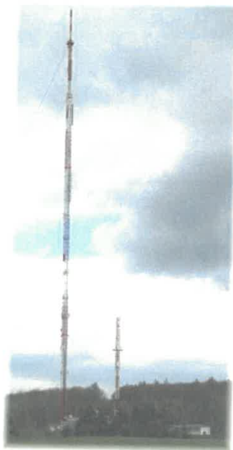
Fot. 1. RTCN Szczecin / Kołowo – widok obiektu