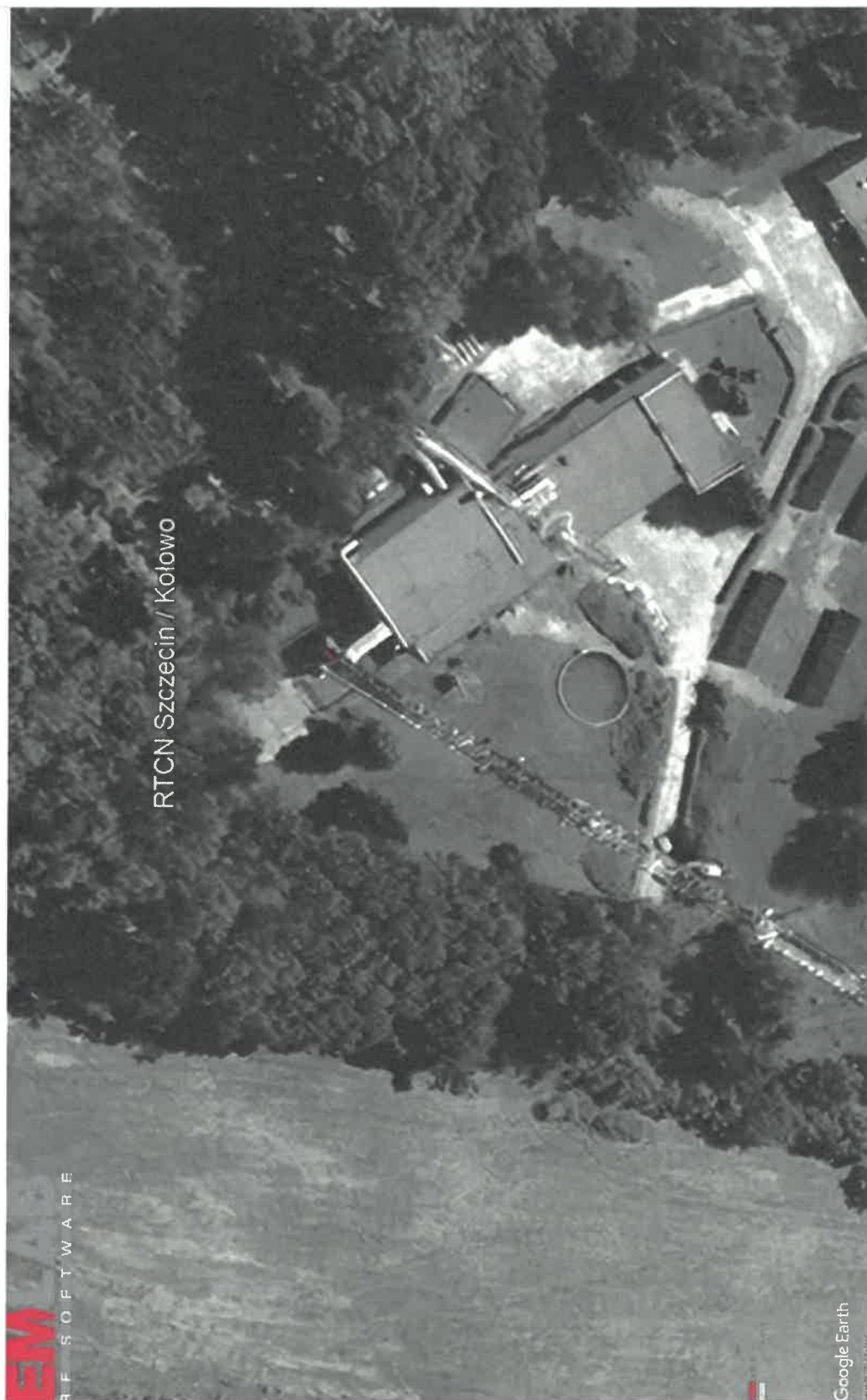
Rys. 2. Rzut poziomy rozkładu pola elektromagnetycznego anteny nowo projektowanej linii radiowej w otoczeniu RTCN Szczecin / Kołowo przewidzianej do zainstalowania na wysokości 100 m nad poziomem terenu.