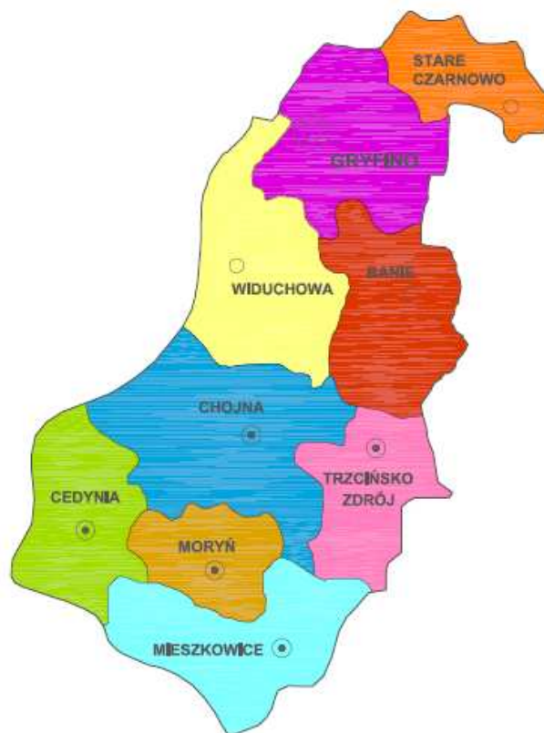
Rysunek 1. Położenie geograficzne gmin powiatu gryfińskiego