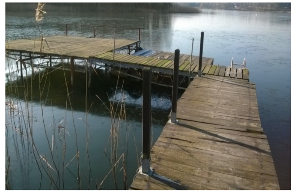
Pomost nr 2