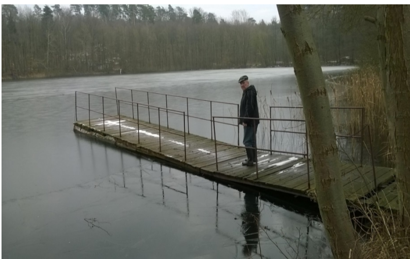
Pomost nr 18