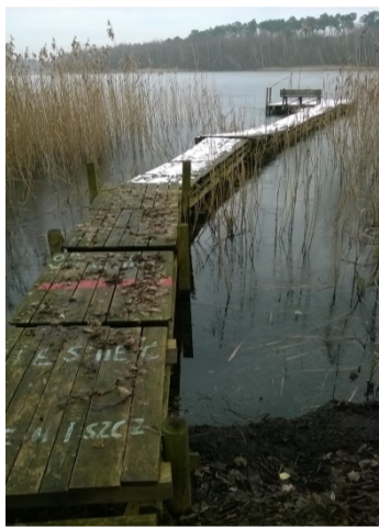
Pomost nr 15