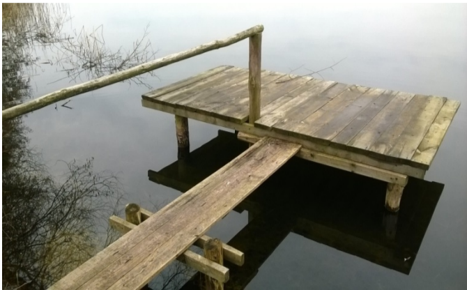
Pomost nr 11