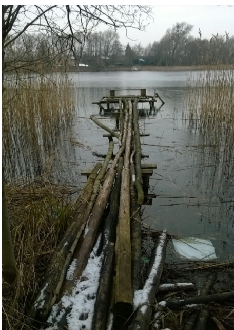
Pomost nr 20