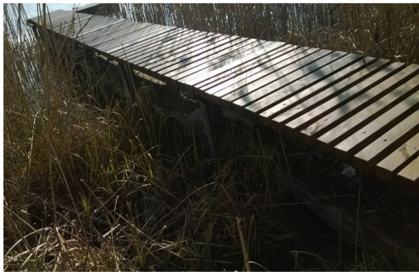
Pomost nr 7