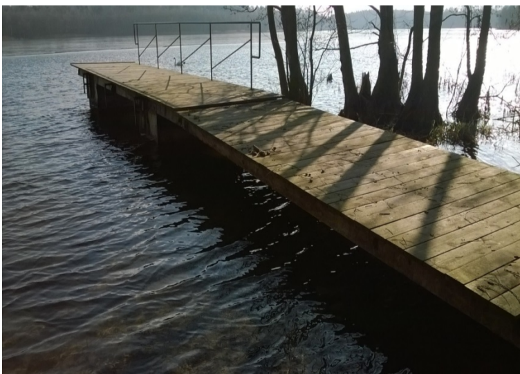
Pomost nr 8