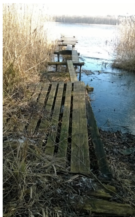
Pomost nr 9