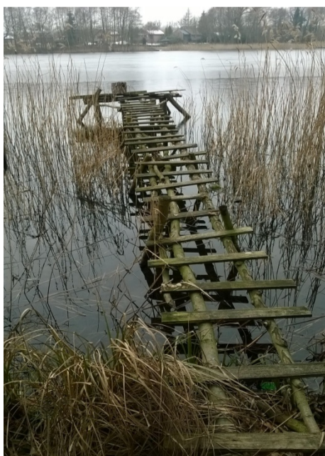
Pomost nr 21