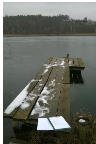
Pomost nr 16