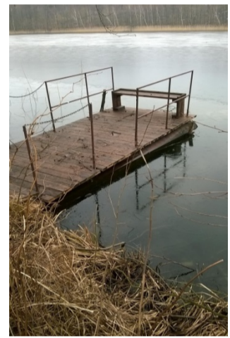
Pomost nr 17