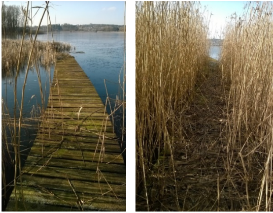
Pomost nr 1