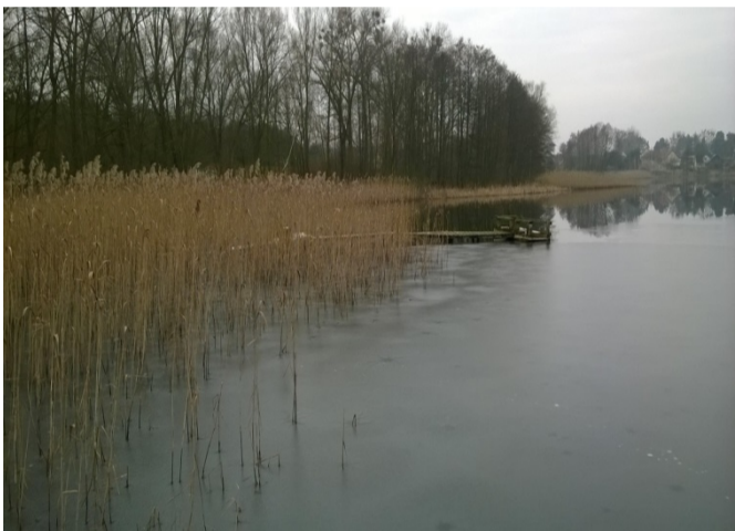
Pomost nr 14