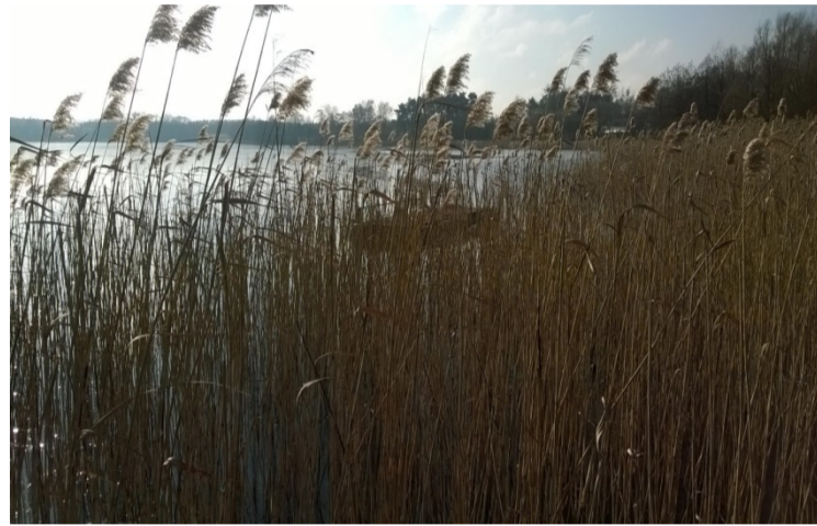
Pomost nr 5 – bez trapu dojściowego