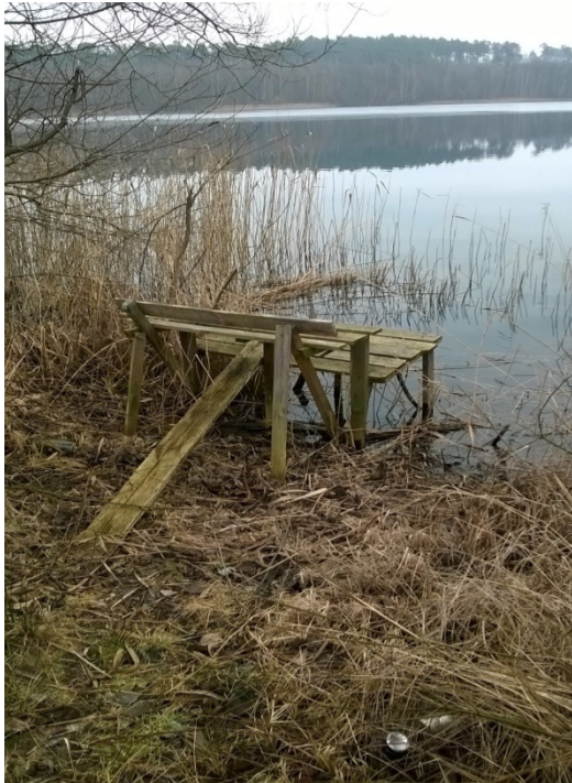
Pomost nr 12