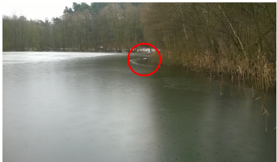
Pomost nr 19