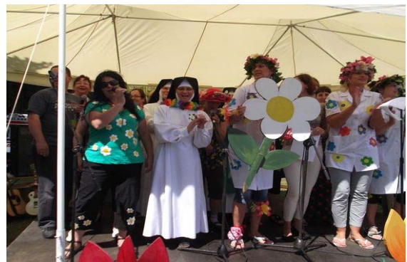
Festiwal „Kwiatowa twórczość”