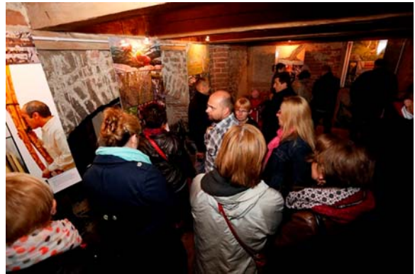
„Cienie zapomnianych kultur” w Kołbaczu