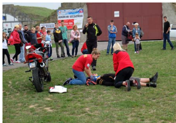
„II Rodzinny Piknik Paralotniowy”