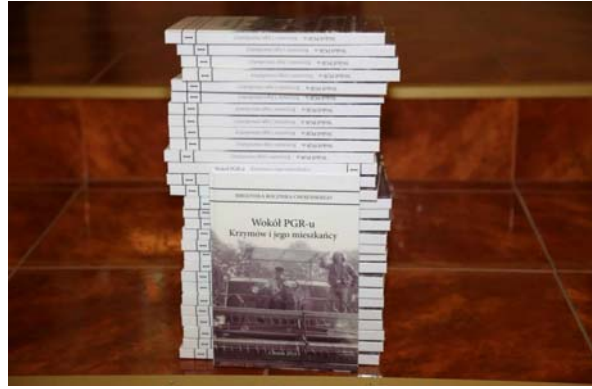
„Druk i promocja książki ze wspomnieniami mieszkańców Krzymowa pt. Wokół PGR-u. Krzymów i jego mieszkańcy”