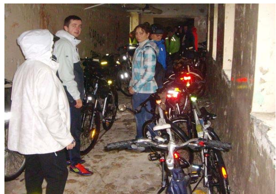
„Gryfińskie Rajdy Rowerowe 2014 – Etap II – Poznajemy siebie”