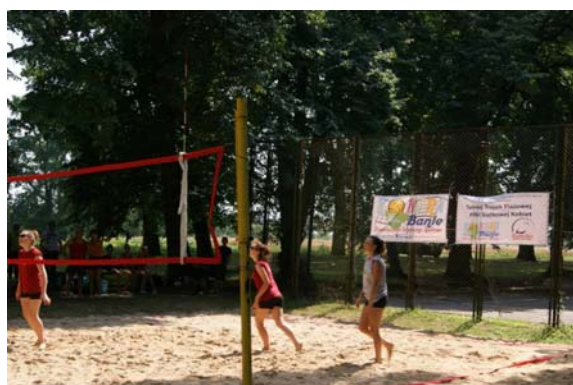
„Turniej trójek plażowej piłki siatkowej”