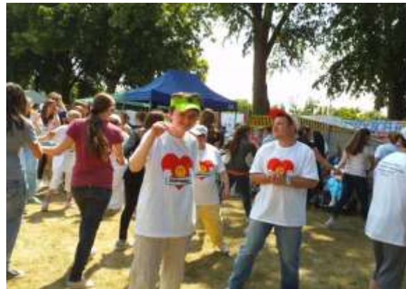
Wspólne koncertowanie „Siejmy Radość”