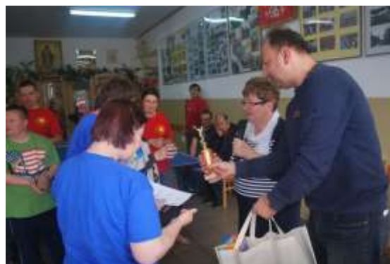
Bądźmy aktywni – powiatowe rozgrywki w tenisie stołowym dla Osób Niepełnosprawnych