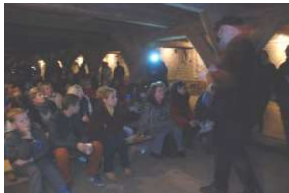
„Cienie zapomnianych kultur 2015” w Kołbaczu