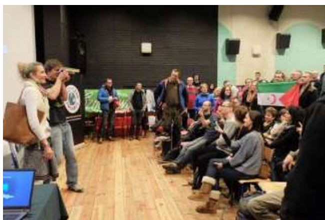
9. Gryfiński Festiwal Miejsc i Podróży „Włóczykij”