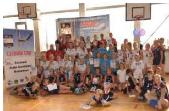
Festiwal Piłki Siatkowej Dziewcząt CICONIA CUP