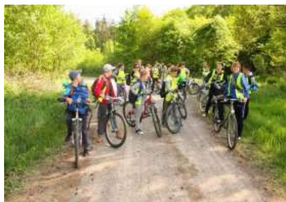
„Młodzi podróżnicy odkrywają niezwykle miejsca powiatu gryfińskiego”