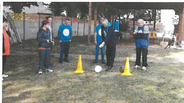
Turniej sportowo-rekreacyjny „Łączy nas sport”