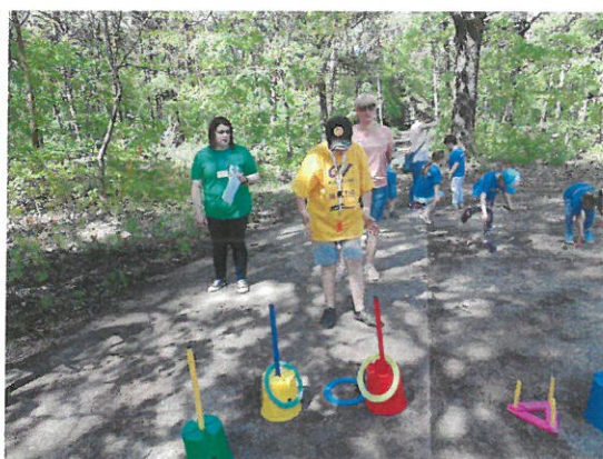
Impreza turystyczno-integracyjna „Leśna Polana”