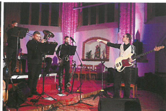
„Cienie zapomnianych kultur w pocysterskim Kołbaczu”