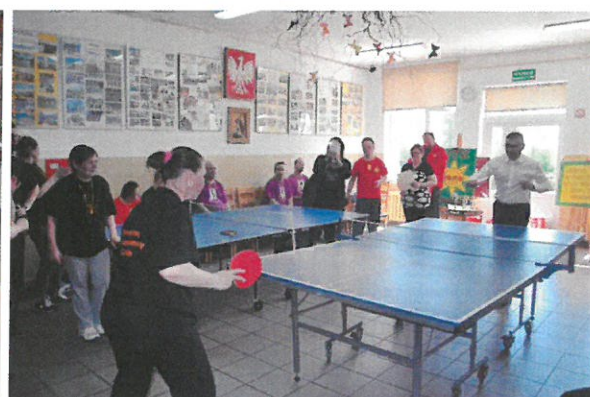
Integracyjne zawody w tenisie stołowym dla osób niepełnosprawnych z terenu powiatu gryfińskiego