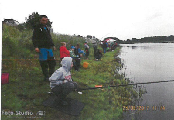
Zawody wędkarskie dla dzieci i młodzieży „Wakacje z wędką”