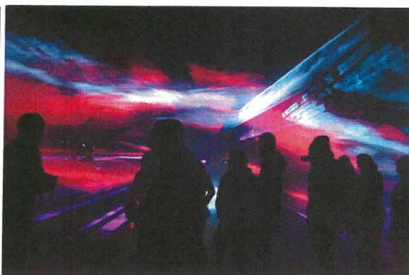
Festiwal światła i wody