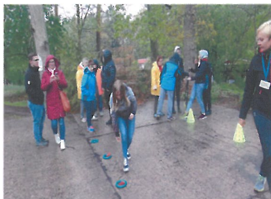
Stowarzyszenie na rzecz Osób Niepełnosprawnych "MOST" w Nowym Czarnowie – Impreza Turystyczno-Integracyjna "Leśna Polana"