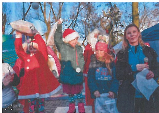
Stowarzyszenie Sportowe "Fani Formy" Szczecin - "Łobuziaki" Biegają i Powiat Gryfiński rozślawiają - II Wielkanocny Bieg Zająca i III Bieg Mikołajkowy dla Łobuziaków