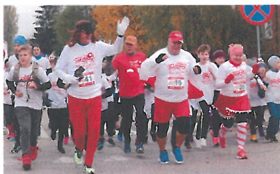
Międzyszkolny Klub Sportowy „Hermes” w Gryfinie – Bieg Niepodległości w nowe stulecie - Gryfino 2019