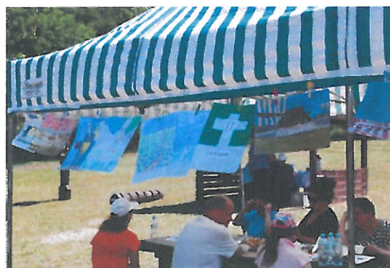
Stowarzyszenie na Rzecz Osób Niepełnosprawnych "PROMYK" Goszków – Szlakiem pamięci I Armii Wojska Polskiego. Warsztaty plastyczne dla osób niepełnosprawnych upamiętniające historię walk wyzwoleniczych w powiecie gryfińskim