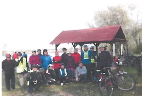
Międzyszkolny Klub Sportowy "Hermes" w Gryfinie - XI Rajd Rowerowy „Na ścieżkach rowerowych powiatu gryfińskiego”