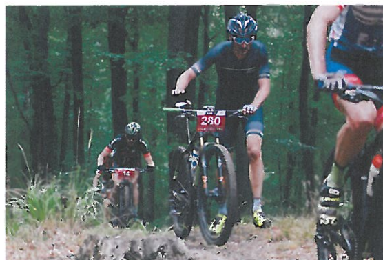
Klub Sportowy ACTIVE LIFE „Maraton Zachodnia Liga MTB Chojna”