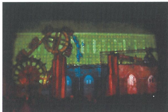
Stowarzyszenie Spichlerz Sztuki Kołbacz - Cienie zapomnianych kultur w pocysterskim Kołbacz