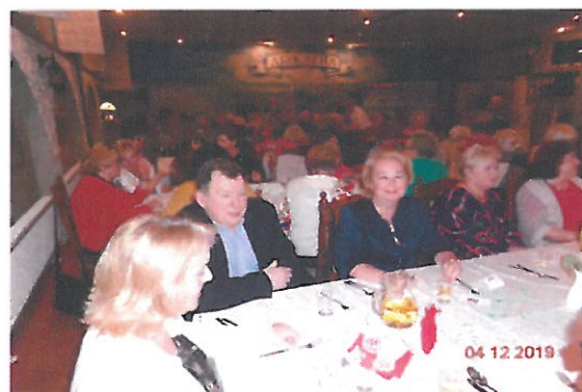
Gryfiński Uniwersytet Trzeciego Wieku - „Aktywny senior – promocja zdrowia”