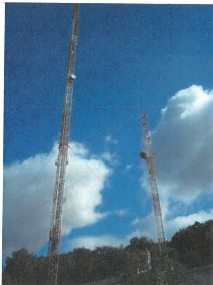
Fot. 1. RTCN Szczecin Kołowo – widok obiektu