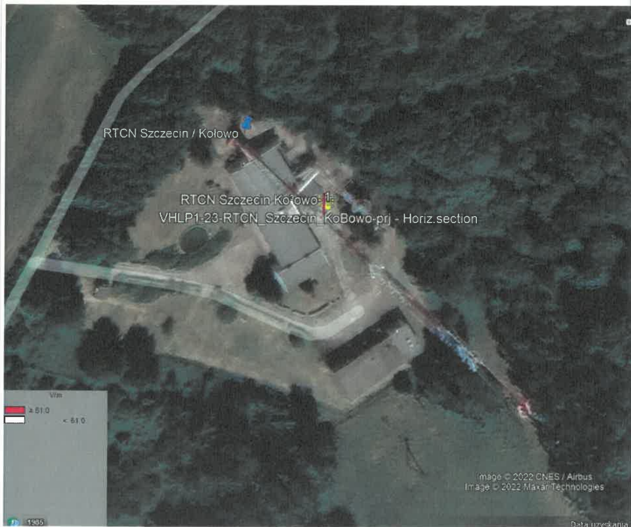
Rys. 2. Rzut poziomy rozkładu pola elektromagnetycznego anteny nowo projektowanej linii radiowej w otoczeniu RTCN Szczecin Kołowo przewidzianej do zainstalowania na wysokości 80 m nad poziomem terenu.