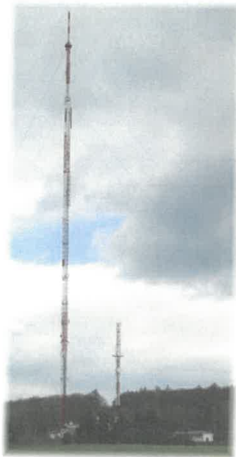
Fot. 1. RTCN Szczecin / Kołowo – widok obiektu