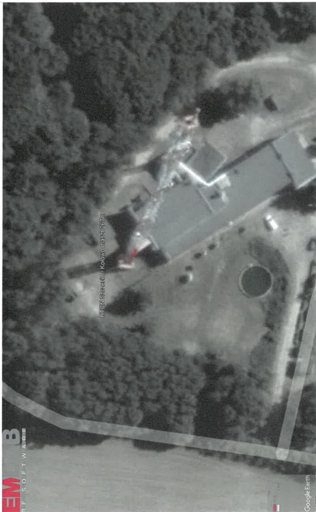
Rys. 2. Rzut poziomy rozkładu pola elektromagnetycznego anteny nowo projektowanej linii radiowej w otoczeniu RTCN Szczecin / Kołowo przewidzianej do zainstalowania na wysokości 140 m nad poziomem terenu.