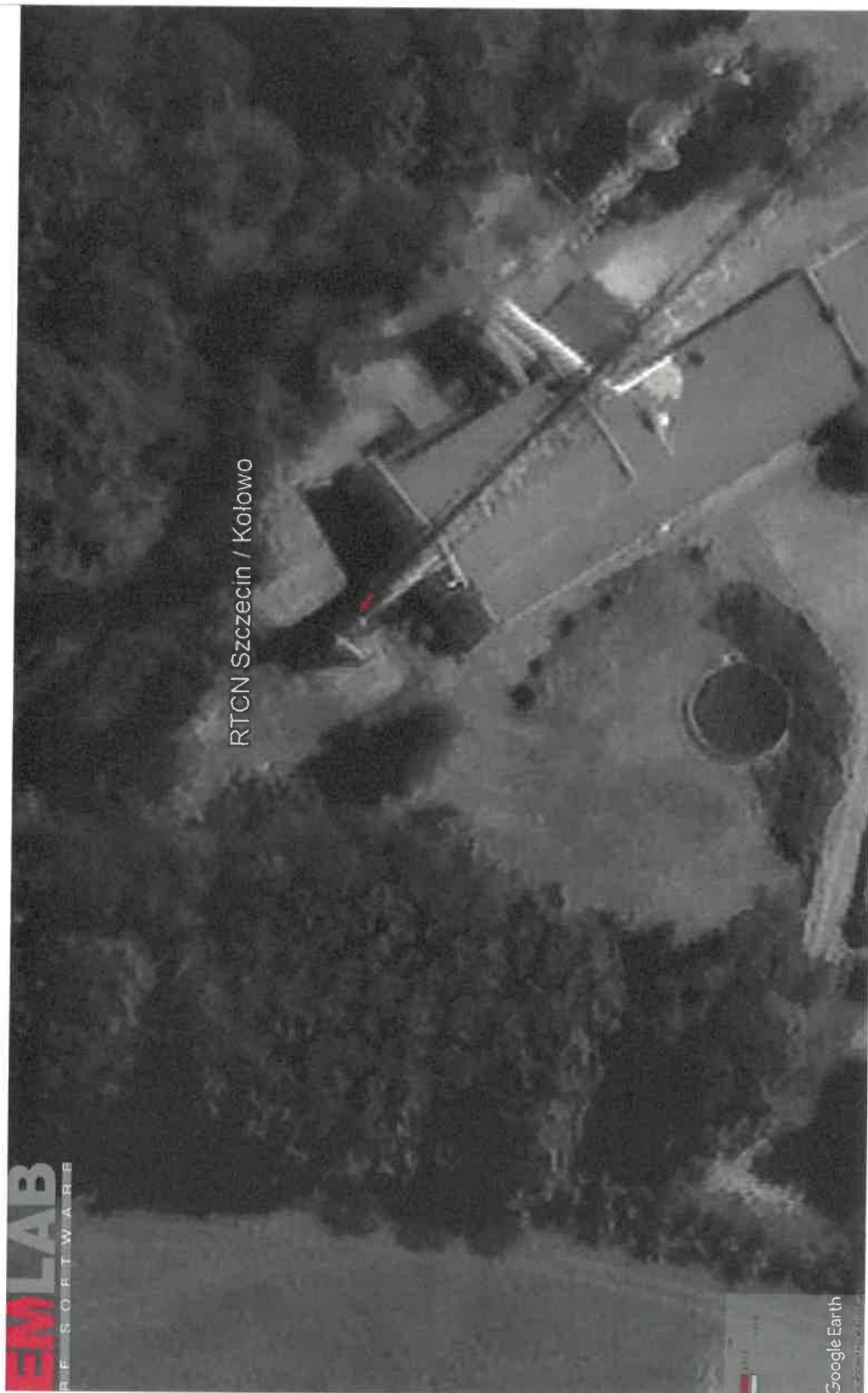
Rys. 2. Rzut poziomy rozkładu pola elektromagnetycznego anteny nowo projektowanej linii radiowej w otoczeniu RTCN Szczecin / Kołowo przewidzianej do zainstalowania na wysokości 100 m nad poziomem terenu.