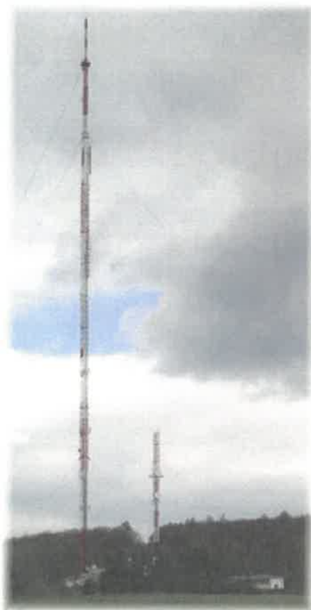
Fot. 1. RTCN Szczecin / Kołowo – widok obiektu