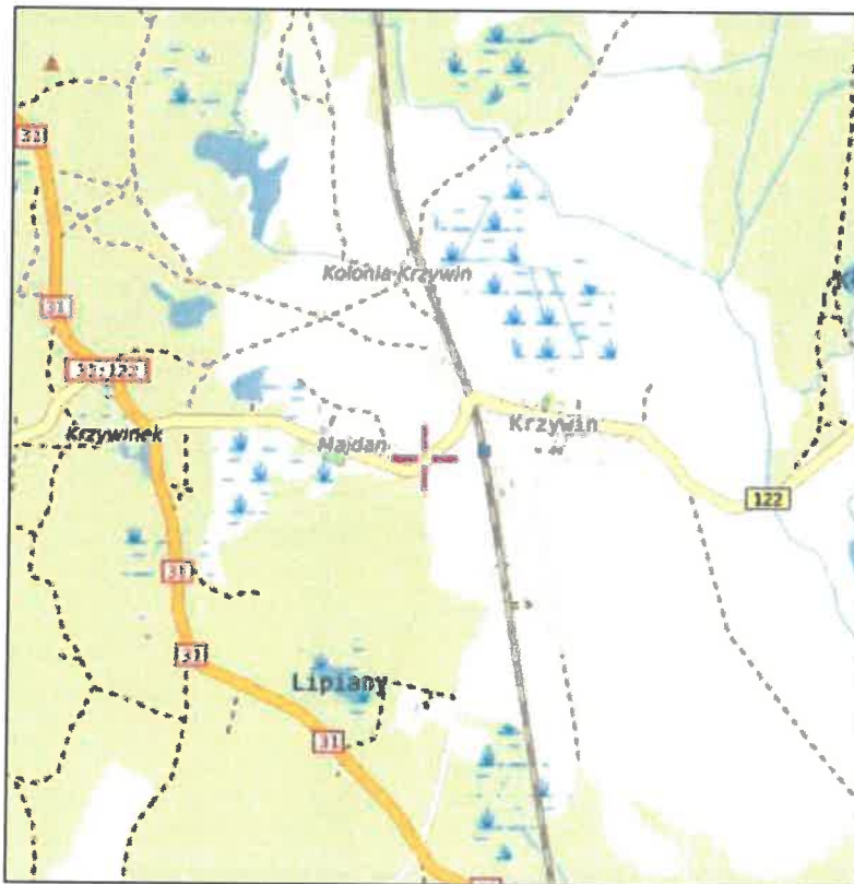
Rys. 1 Lokalizacja badanego obiektu