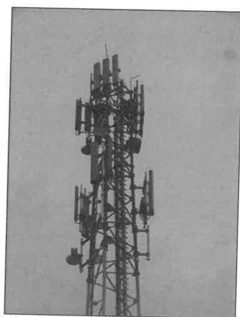
Rys. 3 Widok badanego obiektu