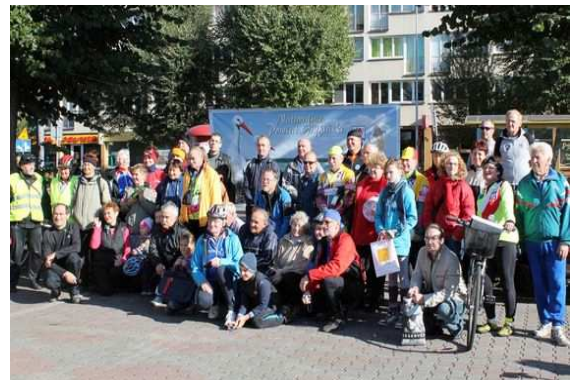
Gryfińskie Rajdy Rowerowe