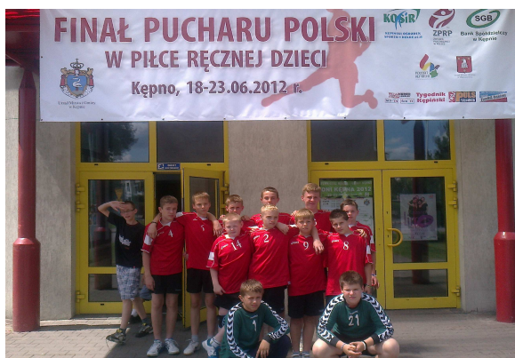
Uczestnictwo młodzieży reprezentującej powiat w imprezach o zasięgu co najmniej wojewódzkim