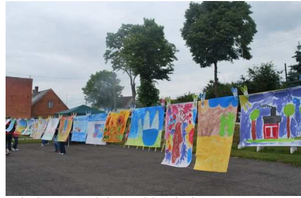
Krajobraz moich wspomnień i marzeń – ukazanie nierozpowszechnionego piękna ziemi gryfińskiej – sztuka osób niepełnosprawnych