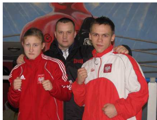
IV Międzynarodowa Gala Boksu o puchar Starosty Gryfińskiego