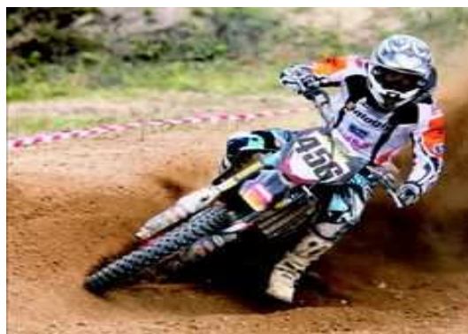
V Runda Międzynarodowych Mistrzostw Strefy Polski Zachodniej w Motocrossie