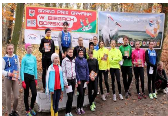
Grand Prix Gryfina w Biegach Górskich