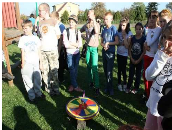
VII Jesienne Marsze na Orientację „KON-TIKInO 2012”