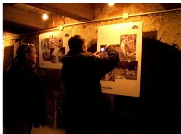
„Cienie zapomnianych kultur”