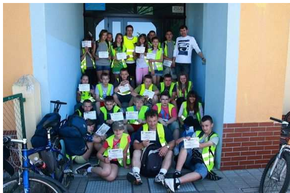
Trzydniowy rajd rowerowy – szukamy śladów średniowiecznych zakonów w powiecie gryfińskim