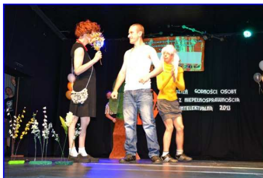
20 lecie PSOOU – Dzień Godności Osoby z Niepełnosprawnością Intelektualną