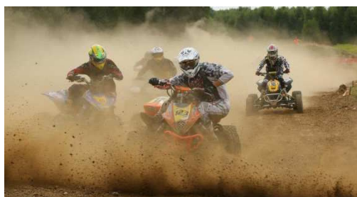
VII Runda Międzynarodowych Mistrzostw Strefy Polski Zachodniej w Motocrossie