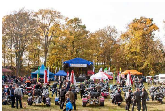
Piknik Crossowy RaKoTEST