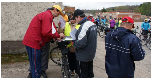
Gryfińskie Rajdy Rowerowe