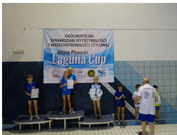
Uczniowski Klub Pływacki Marlin w Gryfinie - Mityng Pływacki Laguna Cup