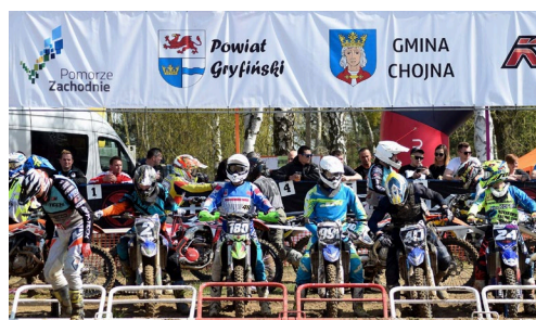
Klub Motorowy Chojna - 1 Runda Mistrzostw Polski w MX Quad i 1 Runda Mistrzostw Strefy Polski Zachodniej w Motocrossie