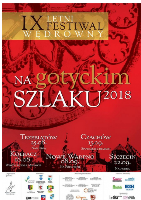
Fundacja Akademii Muzyki Dawnej Szczecin - Na Gotyckim Szlaku - IX Letni Festiwal Wędrowny