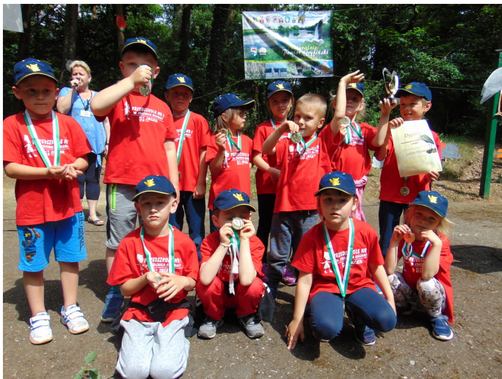
Stowarzyszenie na Rzecz Osób Niepełnosprawnych „MOST” w Nowym Czarnowie – Impreza turystyczno-integracyjna „Leśna Polana”