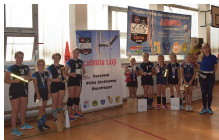
Stowarzyszenie Amatorów Piłki Siatkowej LIBERO w Gminie Banie - IV Festiwal Piłki Siatkowej Dziewcząt CICONA CUP